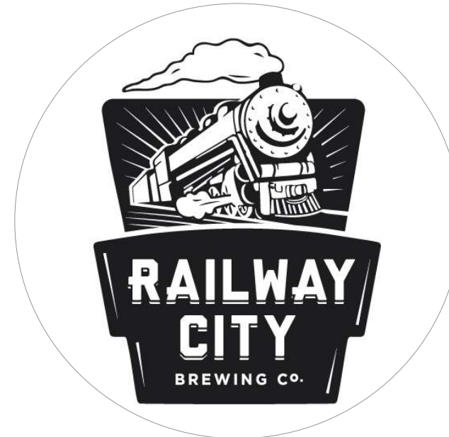
レイルウェイ シティー醸造株式会社 5ページ