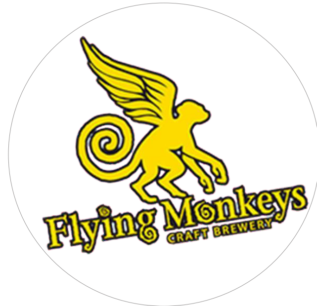
フライング モンキーズクラフト醸造所 3ページ