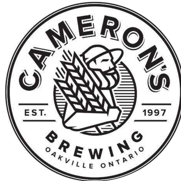
キャメロンズ 醸造所 4ページ